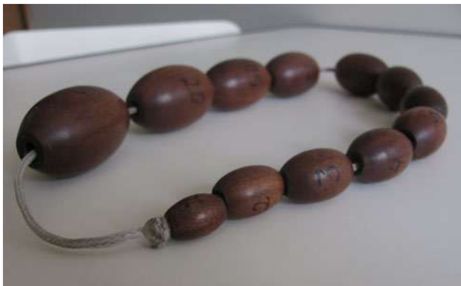
Figura 1 - Orquidômetro