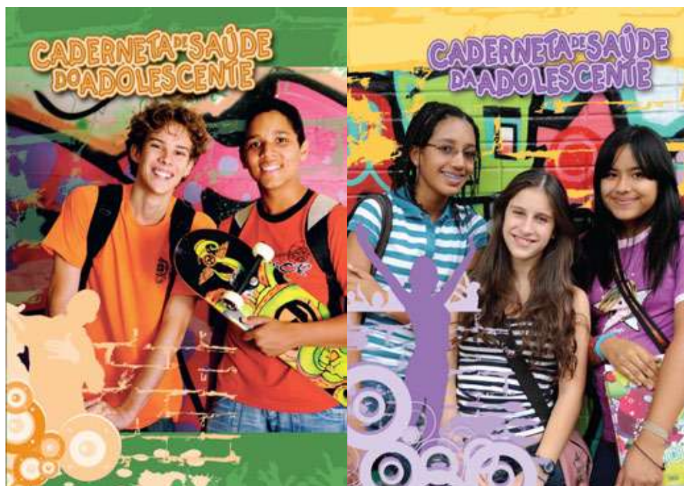
Figura 4 - Capas das Cadernetas de Saúde (do Adolescente e da Adolescente)