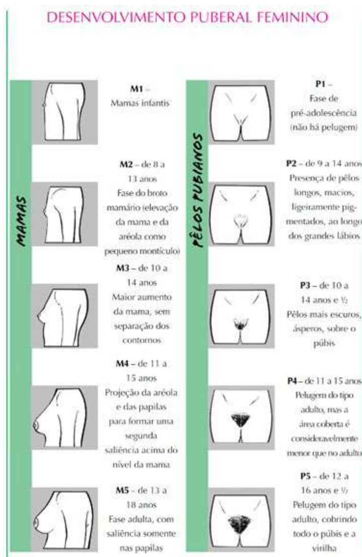
Figura 2 - Critérios de Tanner - Feminino

O desenvolvimento dos sistemas circulatório e respiratório resulta no aumento de força e resistência. Esse processo é mediado pela ação dos esteroides gonadais, hormônio de crescimento (GH) e hormônios tireoidianos. Durante a puberdade, há ganho de aproximadamente 50% do peso e 20% da altura do adulto. A aceleração da velocidade de crescimento é evento precoce durante a puberdade no sexo feminino; o início é entre os estágios dois e três de Tanner. Já no sexo masculino é evento tardio, ocorrendo a partir dos estágios três e quatro de Tanner.